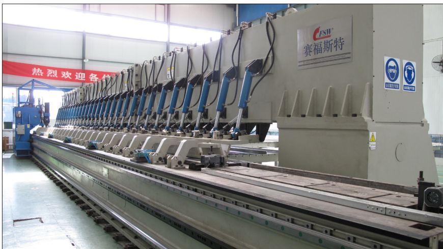
图2 大型铝合金型材拼接搅拌摩擦焊设备

制造所作为全国最大的电解加工设备供应商,研制的大型数控电解加工设备已形成一定的规模,涵盖了航空发动机叶片和机匣、航天发动机整体叶轮、兵器枪炮身管膛线以及民用石油、模具等多个军民行业和领域,行业覆盖率达90%以上。2010年,制造所研制的电解加工装备首次走出国门出口缅甸,先进的工艺和设备获得了用户的高度认可。