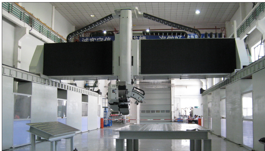
图3 大型复合材料自动铺带机